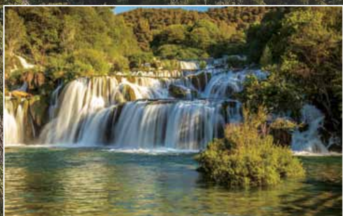
Krka National Park