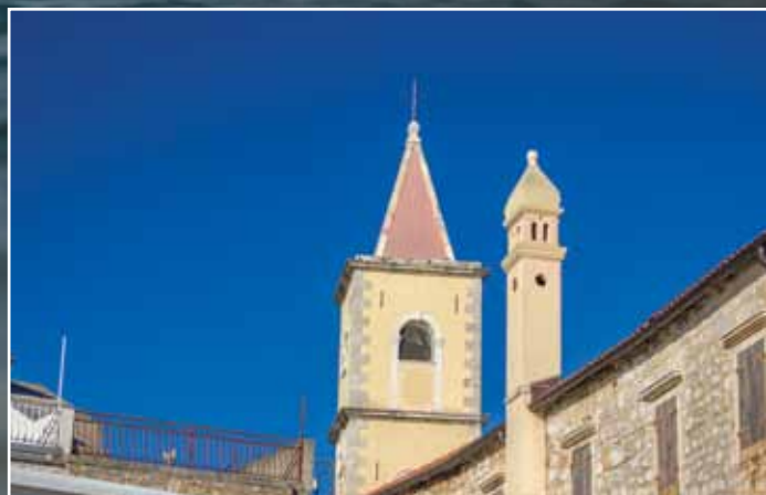
Bell Tower of Our Lady of Mount Carmel Church