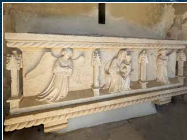
Monument to Petar Jeronim Draganić Vrančić