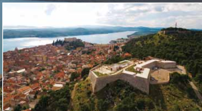
Fortresses of Šibenik

The hidden gem at the heart of Dalmatia.