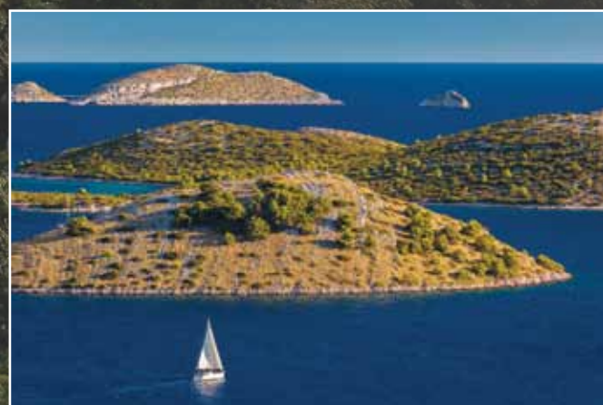
Kornati National Park

Ein verstecktes Juwel im Herzen Dalmatiens.